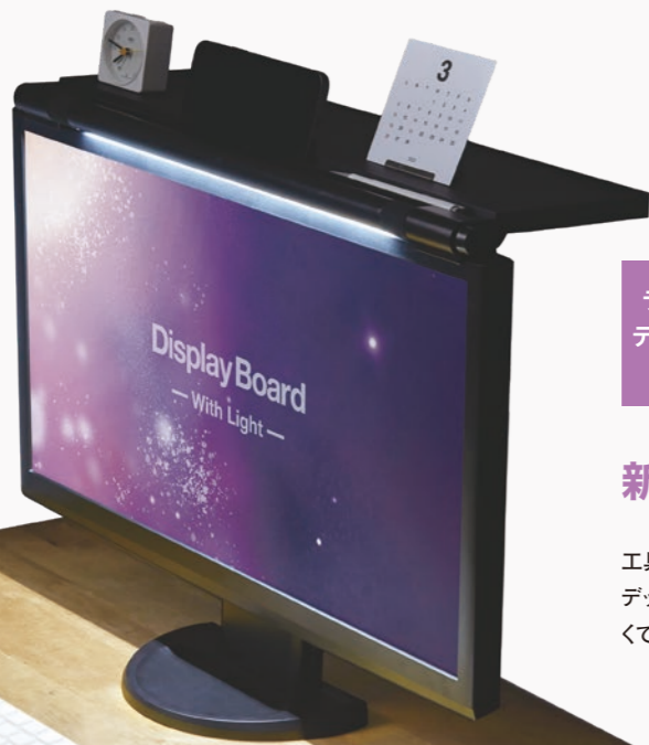
ライト付きディスプレイボード

煩わしい音響機器の準備や難しい設定をすることなく、電源を入れるだけですぐに使えるマイク型の拡声器です。会議や説明会のほか、災害時の誘導にも活躍します。