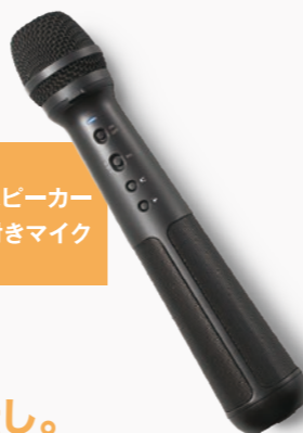
スピーカー付きマイク

WEB会議が普及し便利になった一方で、長時間イヤホンを装着していると生まれる不満もあります。「コールミーツ」は耳をふさがず空気振動で音を届け、耳への圧迫感や不快感を軽減します。