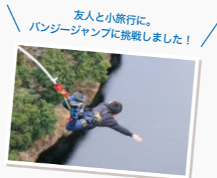
友人と小旅行に。バンジージャンプに挑戦しました！