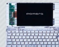
デジタルメモ「ポメラ」 「DM250X Crystal」

商品を便利に使っていただくだけでなく、その商品自体のディープなファンになっていただくこと、そしてファンの方々と一緒に楽しむことも、私たちは大切にしています。話題になった「キングファイル」をモチーフにしたオリジナルグッズやデジタルメモ「ポメラ」の15周年を記念したスケルトンモデルなどもそんな取り組みの一環です。ワクワク感をファンの方々と共有しながら、遊び心あふれるキングジムらしさを伝えています。