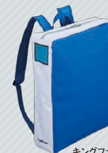
キングファイル バックパック