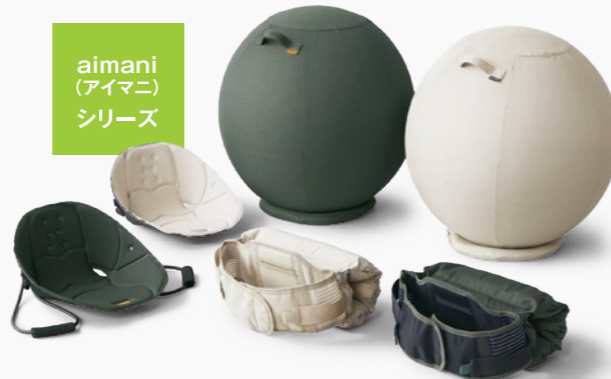
aimani (アイマニ) シリーズ

「すきま時間にセルフケア」をコンセプトに開発した、正しい姿勢や体幹をケアできる健康用品シリーズ。自宅でのデスクワーク時間の増加や健康経営の流れに応えるワークスタイルを提案しています。