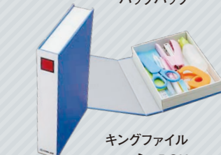
キングファイル ミニBOX