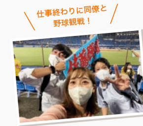
仕事終わりに同僚と野球観戦！