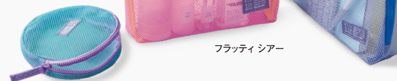
フラッティ シアー